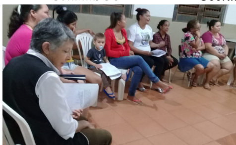
Comunidade Mãe da Esperança Frutal/MG