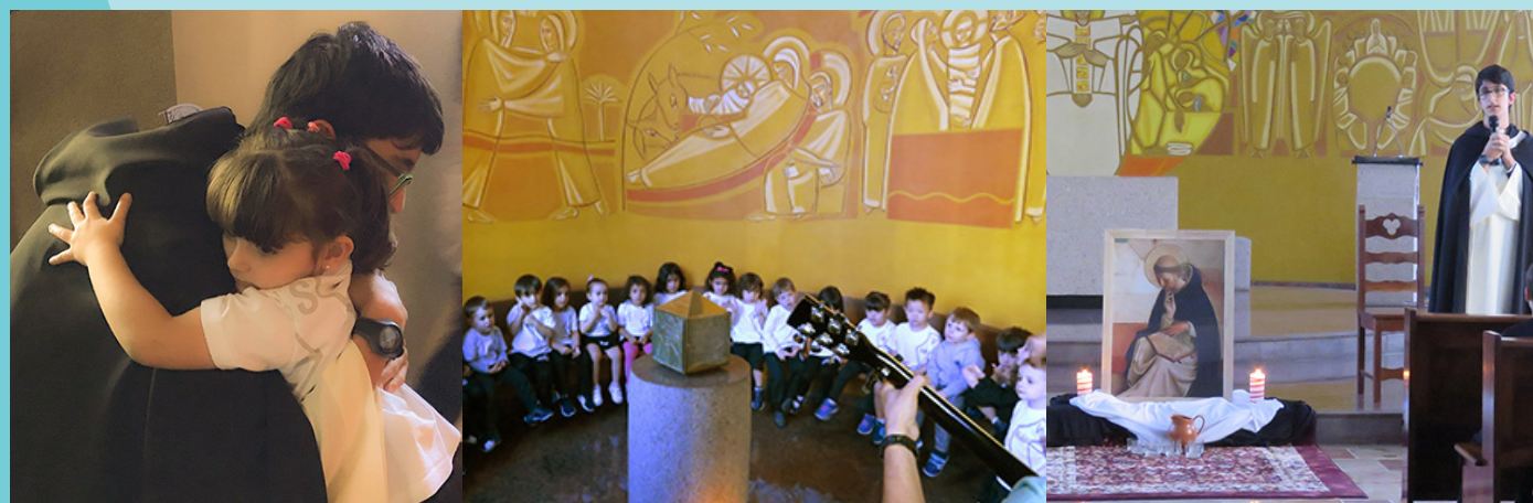
Colégio Nossa Senhora do Rosário - São Paulo/SP