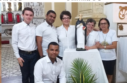
Comunidade Irmã Gertrudes Mamanguape/Paraíba