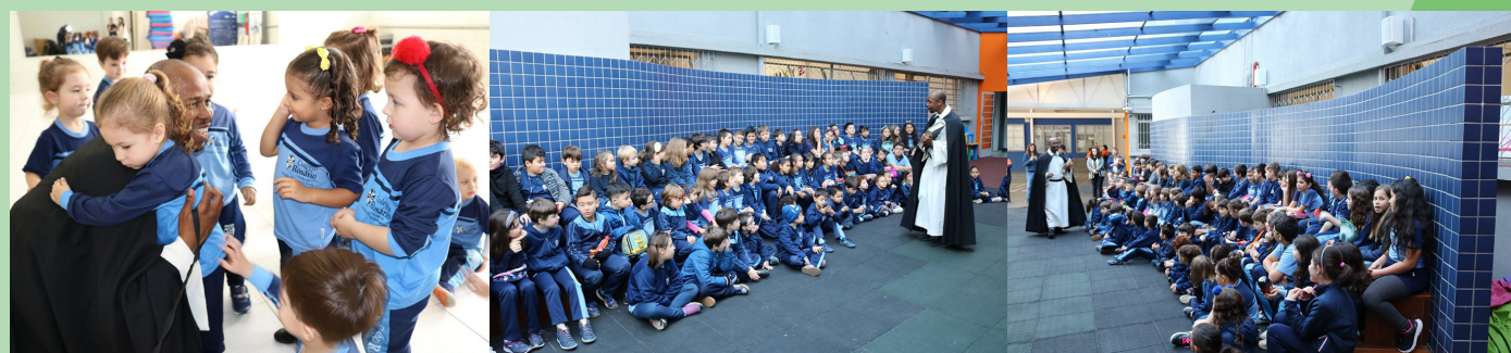
Colégio Nossa Senhora do Rosário - Curitiba/PR