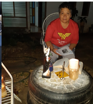
Comunidade São Domingos Palmas/TO