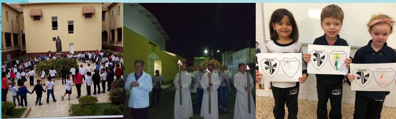
Colégio São Domingos - Araxá/MG