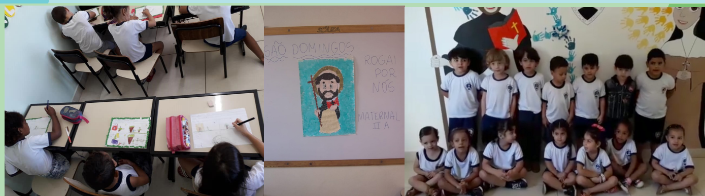
Centro de Educação Infantil Marta Carneiro - Uberaba/MG