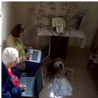
Comunidade Bem Viver Goiânia/GO