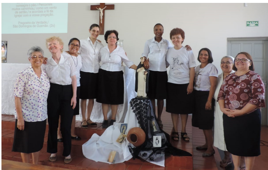
Comunidades da Casa de Formação Madre Anastasie e Comunidade do Colégio Sagrado Coração de Jesus - Porto Nacional/TO

Domingos, pregador itinerante, foi um homem de personalidade extremamente rica. Tinha a palavra fácil e arrebatadora. Afável e cativante seduzia os que o conheciam. Dotado de aguda