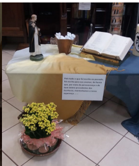
Fraternidade Betânia Uberaba/MG