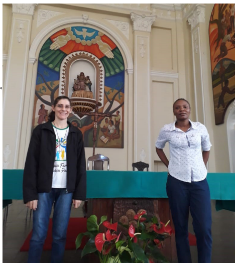
Visita à Catedral de Goiás

No dia 7 de julho, as noviças da Casa de Formação de Tocantins chegaram na Comunidade do Externato São José para uma belíssima vivência com as Irmãs durante quinze dias.