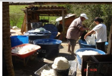
COMUNIDADE PREPARANDO PARA FAZER FARINHA