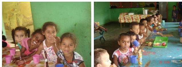
CRIANÇAS DA ESCOLA RURAL