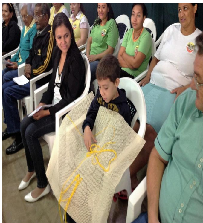
Família Dominicana nunca morra. Com o coração preenchido de gratidão,